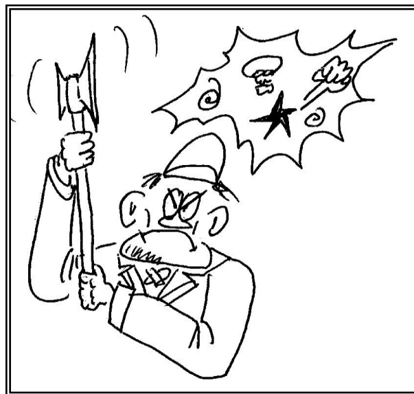
Un stagiaire allergique à la question